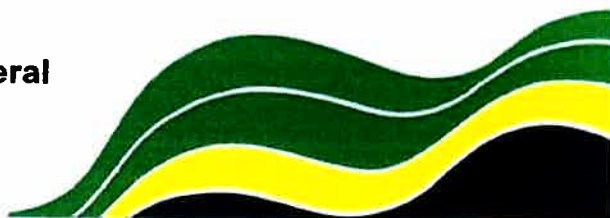
Otávio de Souza Gomes Controlador-Geral do Estado do Amazonas